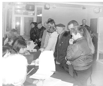
Видача бюлетенів для голосування