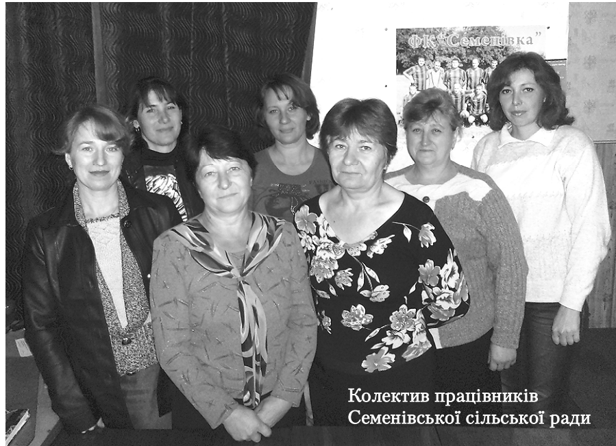
Колектив працівників Семенівської сільської ради

У 2012 році народилося 25 дітей. Народжуваність продовжує перевищувати смертність (23). Укладено 8 шлюбів. Кількість дворів – 695, кількість сімей – 681.