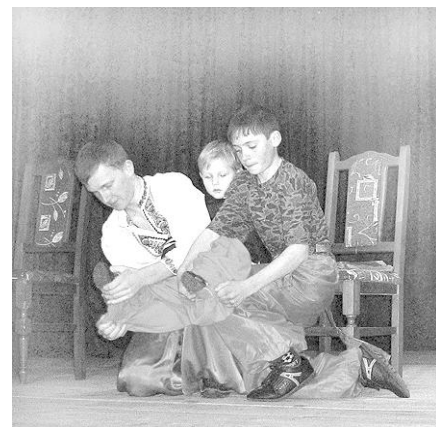
Це робота не проста – одягнути козака!

віджимання звичайним способом, а найменші демонстрували техніку стояння на одній нозі.