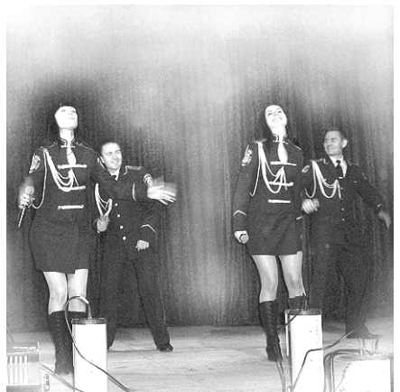
Агов! Дяді, тьоті, дідуся й бабусі! Коли наступне свято?

Бажаю, щоб наші заклади культури отримували більшу спонсорську допомогу і могли ще ширше розгорнути свою роботу. І щиро дякую миколаївському ансамблю «Южный патруль» за прекрасний концерт.