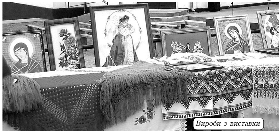
Вироби з виставки

Щиро дякую всім учасникам виставки за надані роботи, які зробили свято ще яскравішим.