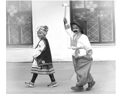
А поки що помилуйтеся маленькими артистами з нашого ДНЗ „Перлинка” та й чекайте того спеціального номера.

Дійство це таке багатопланове, що, мабуть, побачити все не змогла жодна людина, а як же описати в газеті те, що неможливо охопити у житті? Щоб хоч якось поправити цю картину, вирішено зробити спеціальний додатковий номер нашої газети і зробити його трохи більшим тиражем. Він не забариться. І спонсор для цієї справи вже знайшовся.