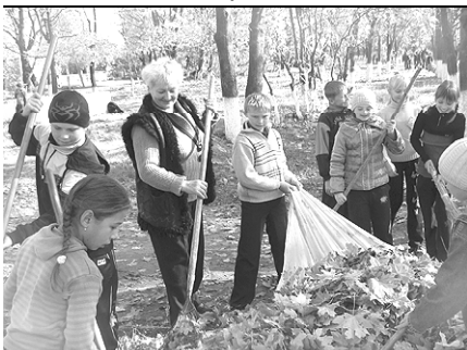
20 жовтня учні та вчителі школи працювали у парку