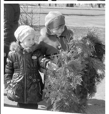
На фото: під час мітингу та покладання квітів 22 березня 2011 р.