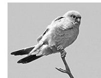
Кібчик – малий сокіл. Це рідкісний птах, що мешкає на наших теренах у складних умовах.

Люди розоряють гнізда граків, сорок, ворон, відстрілюють їх. Від цього страждають і кібчики, адже вони оселяються в гніздах цих птахів. Лісосмуги останнім часом інтенсивно вирізають. У результаті – птах швидкими темпами втрачає свої середовища існування.