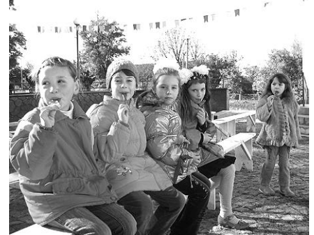
На фото: чекають концерту

Про все це читайте далі в газеті, а також на сайті sbk.innet.org.ua .