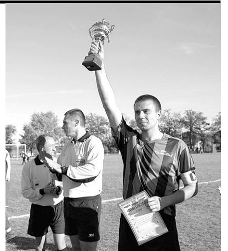
Кубок за друге місце – теж почесна нагорода.

14 жовтня запам'ятається ще і як день великого, за нашими мірками, футболу. Оновлений стадіон, евро сітки на воротах, нові прапорці, суддівська бригада і, звичайно, футбольна команда Миколаїв-2 – все це показало, яким видовищним може бути футбол. На матчі був присутній губернатор Миколаївщини М.П.Круглов (адже гра проходила на його кубок), почесний президент МФК „Миколаїв” Валеев А.К., посадові особи з Миколаєва, Арбузинки та нашого села. І хоч перемогли гості (1:3), але насправді переміг футбол, перемогла дружба, перемогла наша громада і вся область. Світ став кращим.