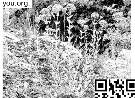
Більше про смілку бузьку читайте в Червоній книзі України за цим QR-кодом.

Смілка зникає через чутливість до посухи, низьку конкурентоспроможність сходів, швидку втрату схожості насіння, схильність до ураження грибовими хворобами та комахами, вузьку спеціалізацію до комах-запилювачів та людський вплив: знищення місцезростань виду, випас та відпочинок у місцях, де росте ця рослина. Смілка бузька занесена до Європейського червоного списку. Це рослина до 100 см заввишки, листки до 10 см завдовжки, з великими суцвіттями.