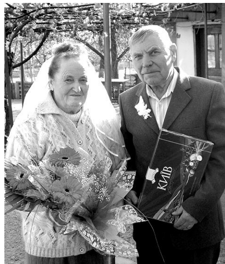
У родині нашій нині свято. Ми щиро хочемо сьогодні

привітати Надійних, щедрих, милих, рідних... Найкращих у світі «молодих» З весіллям діамантовим вітаємо, Добра, здоров'я і достатку вам бажаємо.