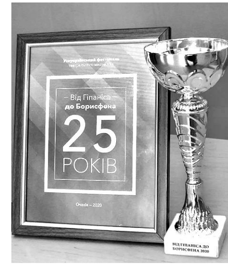
На фото: почесний трофей – Гран-прі 25-го ювілейного Всеукраїнського фестивалю театрального мистецтва «Від Гіпаніса до Борисфена»